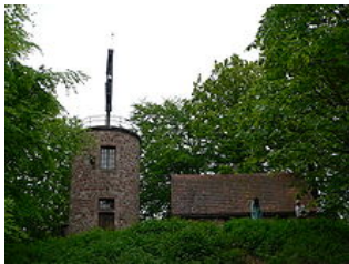
Une tour-sémaphore près de Saverne (France).