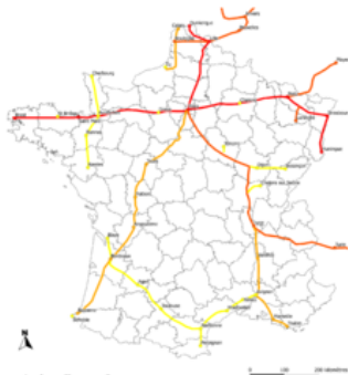
Carte du développement du réseau Chappe en France.

Les Britanniques développèrent une série de tours sémaphores qui permirent des communications