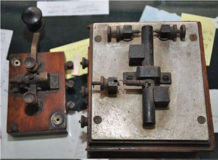
Non, le Morse n'est pas un moyen de communication aussi ringard qu'il en a l'air. Wikipédia

Il existe encore aujourd'hui de nombreuses raisons d'apprendre à communiquer en Morse.