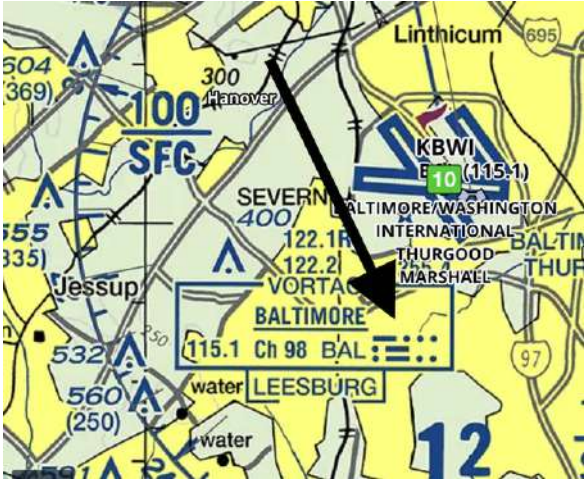
La flèche désigne l'encart indiquant l'équivalent en Morse de l'indicatif « BAL » d'une balise radio près de Baltimore. Capture d'écran recadrée d'une carte de l'administration de l'aviation civile américaine. Edited screenshot of an FAA map, CC BY-ND

Les pilotes se servent eux aussi du Morse pour identifier les stations automatisées d'aide à la navigation. Il s'agit de balises radio qui les aident à suivre leur route, en volant d'un émetteur à l'autre en fonction des indications de leur feuille de route. Elles transmettent leurs identifiants – comme « BAL » pour Baltimore – en Morse. Les pilotes apprennent souvent à reconnaître le signal sonore des balises situées dans les zones qu'ils survolent fréquemment.